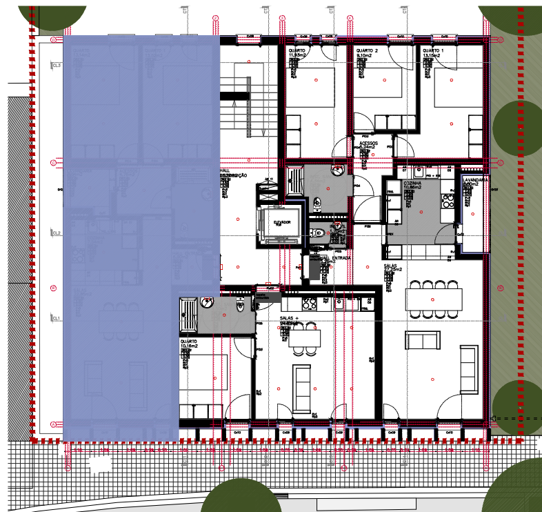
PLANTA PISO 3 - PROPOSTA